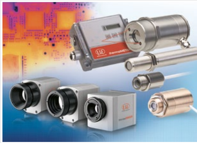
非接触測定向けのセンサと測定装置