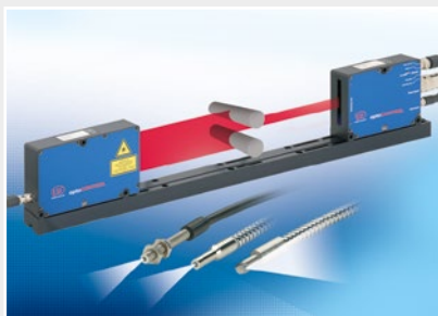
光式マイクロメータ、光ファイバ測定/試験増幅器