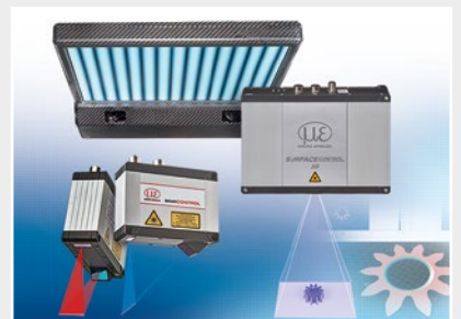
寸法検査および表面検査のための3D測定機器

注意 記載しているデータ等は参考値でありご使用条件、その他諸条件によりカタログ或いは仕様書記載のデータ値とは異なる場合があります。