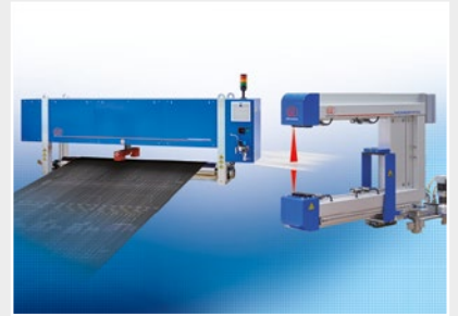
品質管理のための測定および検査システム