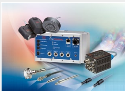
色識別用センサ、LEDアナライザ、インライン色分光計