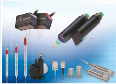
変位、位置、寸法向けのセンサとシステム