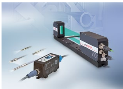
Optische Mikrometer, Lichtleiter, Mess- und Prüfverstärker