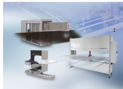
Mess- und Prüfanlagen zur Qualitätssicherung