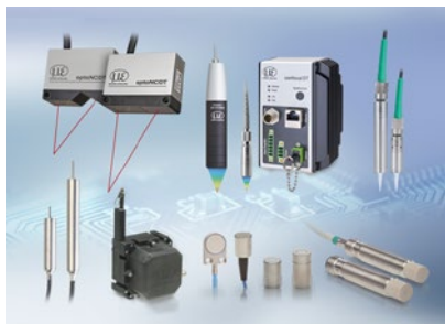
Sensoren und Systeme für Weg, Position und Dimension