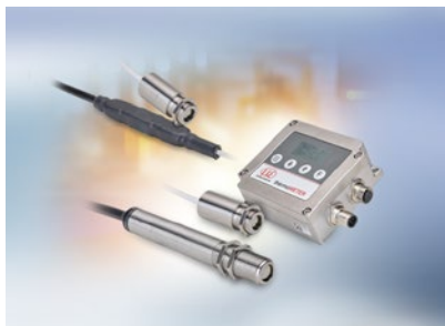
Sensoren und Messgeräte für berührungslose Temperaturmessung