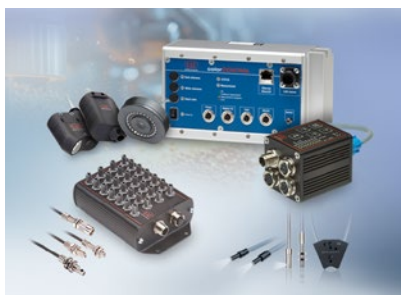
Sensoren zur Farberkennung, LED Analyser und Inline-Farbspektrometer