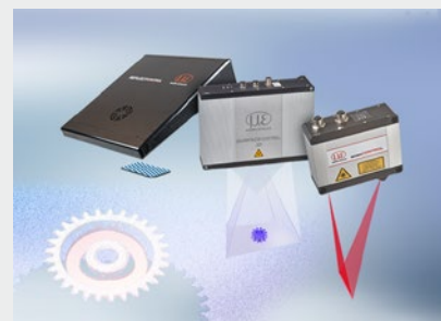
3D Messtechnik zur dimensionellen Prüfung und Oberflächeninspektion